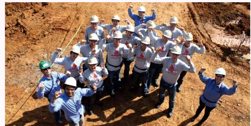
Participantes do Programa Acreditar

As aulas teóricas foram ministradas na Estação da Cultura, em Montenegro e as práticas na Unidade do Senai de Montenegro.